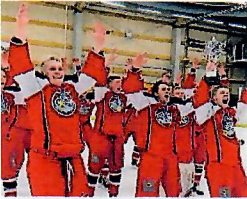
Meistarar Akureyringar fagna.