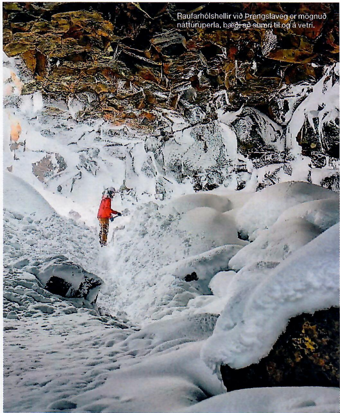
Raufarhólshelli við Þrengslaveg er mögnuð náttúruperla, bægt að stund til og á vetri.

Pegar blaðamaður veltir vöngum yfir þessu stórhuga verkefni og hvornig það tengist eignarhaldi adventista er ekki hjá því komist að minnst eins fallagasta en torræðasta texta sem Gamla testamentið hefur að geyma. Hann fjallar einmitt um námur og gróft eftir eðalsteinum. Hann er að finna 128. kafli Jobsbók. Þar segir: „Menn héldu myrkrinu í skefjum þegar þeir könnuðu grjótið í dimmu og niðanmyrri.“ Vísar textinn til þess að menn leyti gersma í jörðu en að þar sé þó ekki viskuna að finna. Hitt má þó fullyrða að það þarf bæði hugmyndaflugg í bland við einhvers konar vísu til að láta sér detta í hug að blanda saman jarðefnum úr tveimur íslenskum fjöllum, flytja þau til Evrópu og byggja úr þeim hús.